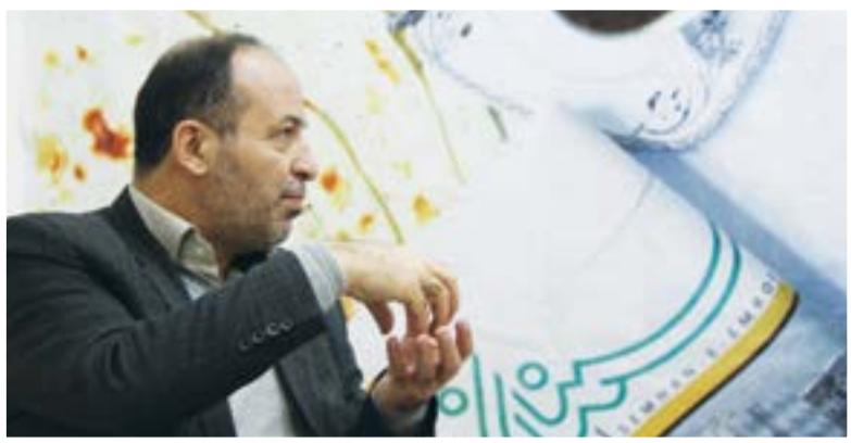
زائران امام علی بن موسی الرضا (ع) باشیم.