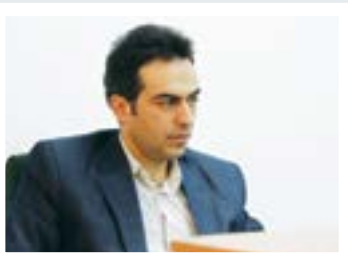
السلام علیک یا ربیع الانام

سمنان، شهر مومنان و عارفان، مفتخر است که با سقهای تاریخی و فرهنگی، پذیرای مسافران و زائران امام علی بن موسی الرضا (ع) باشد.